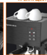
Платформа для подогрева чашек