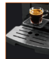
Платформа для маленьких чашек