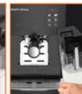
Съемный резервуар для молока (400 мл)